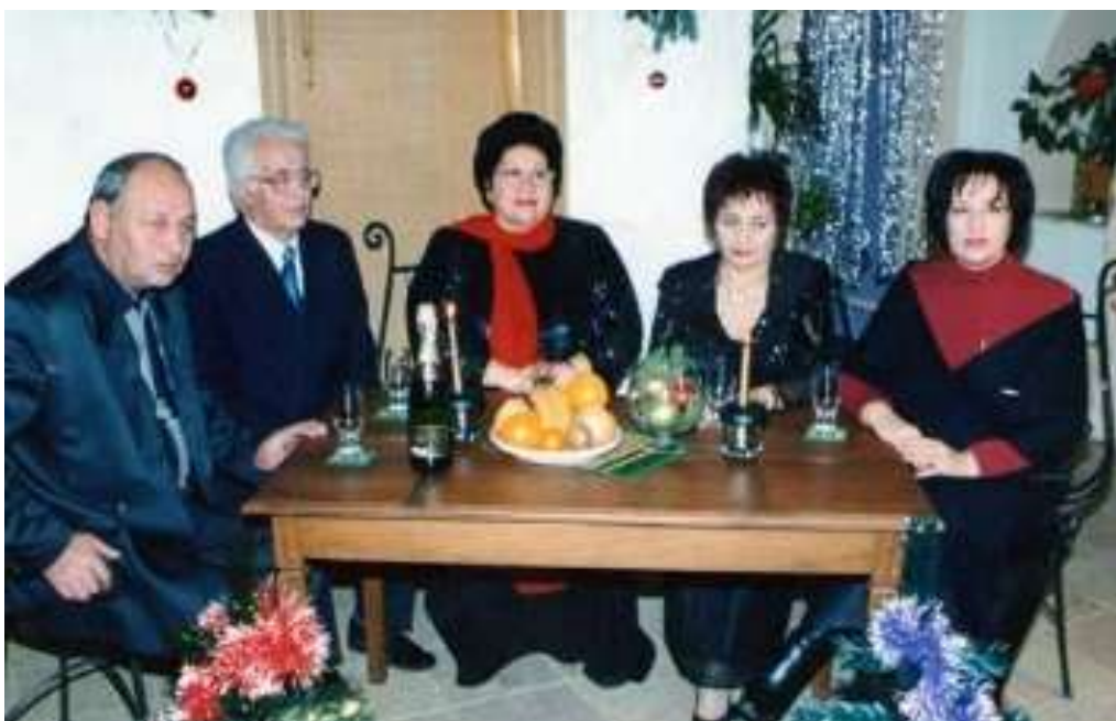
Встреча Нового 2003 года