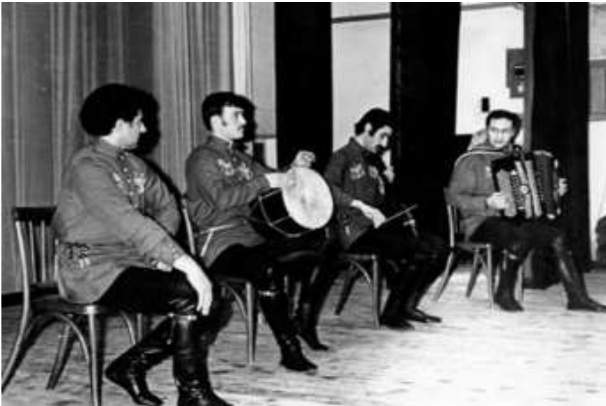
Из альбомов... В «Нальмесе»