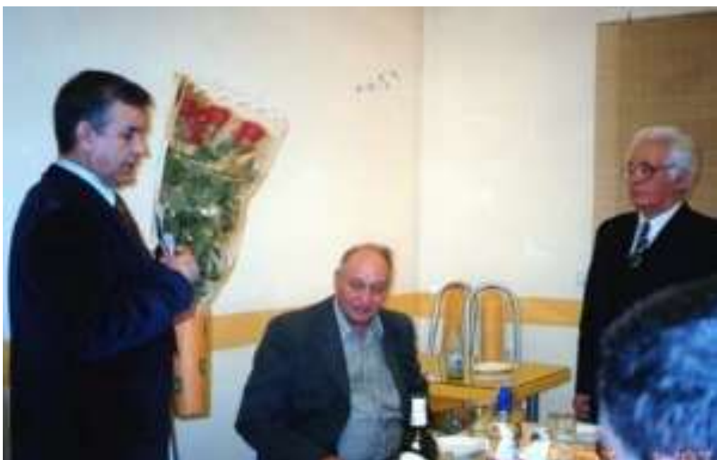
Поздравление с юбилеем