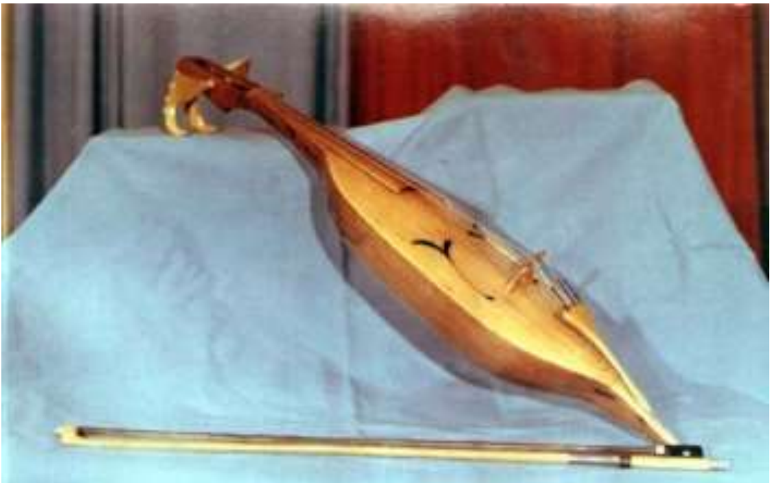
Изготовлено своими руками