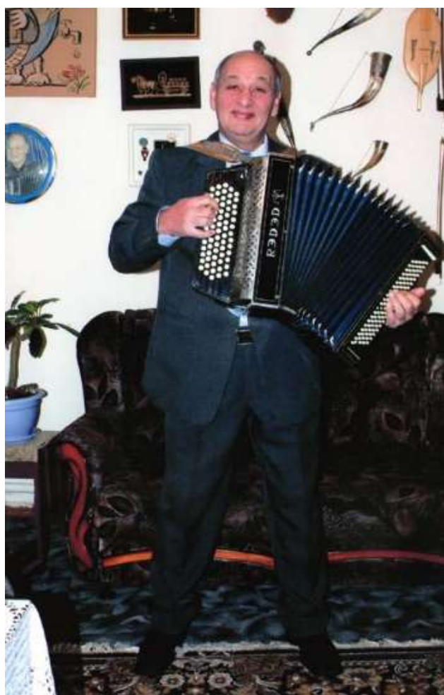
С любимым инструментом в руках